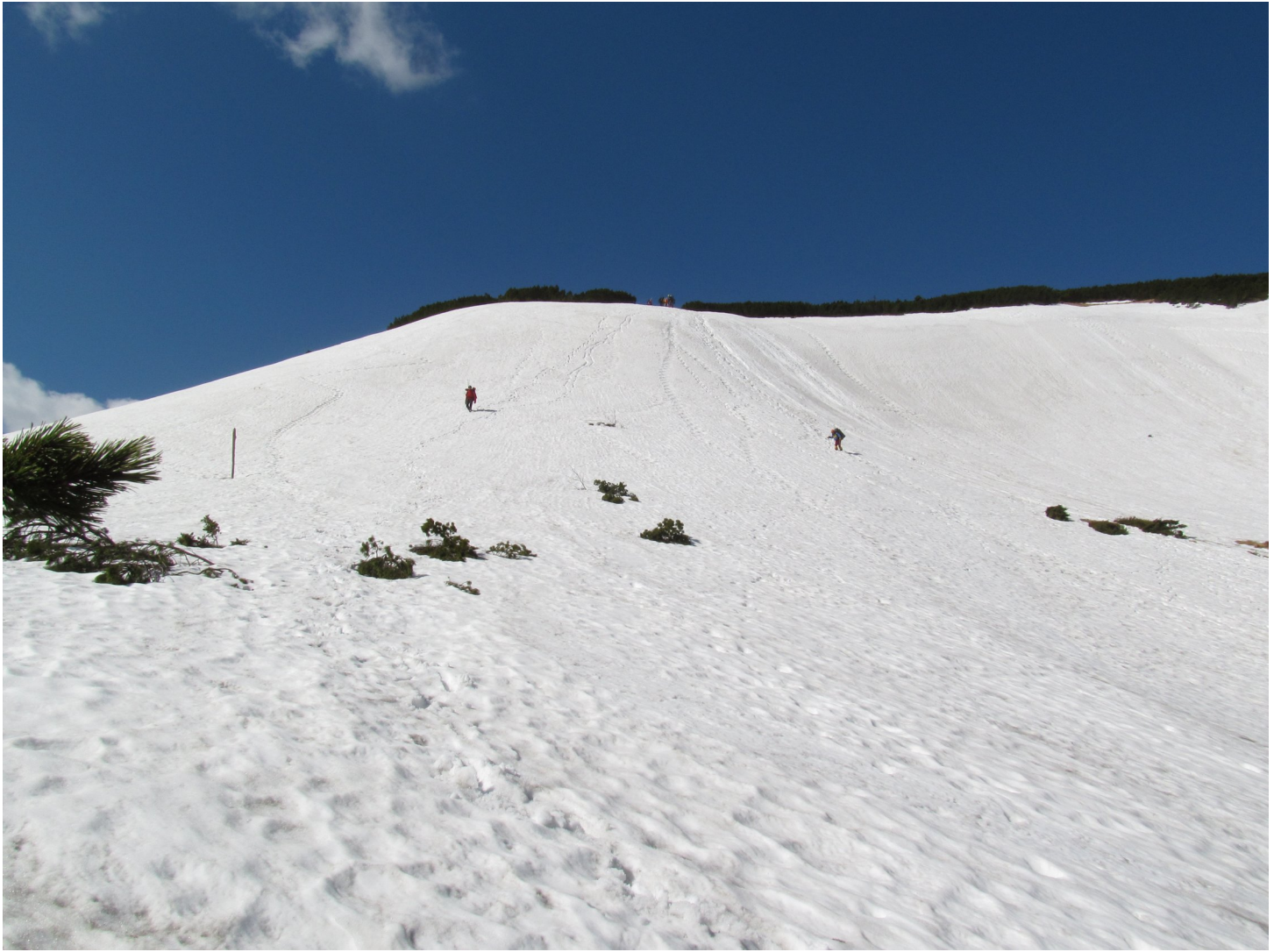
Фото 11: Нижче Несамовитого