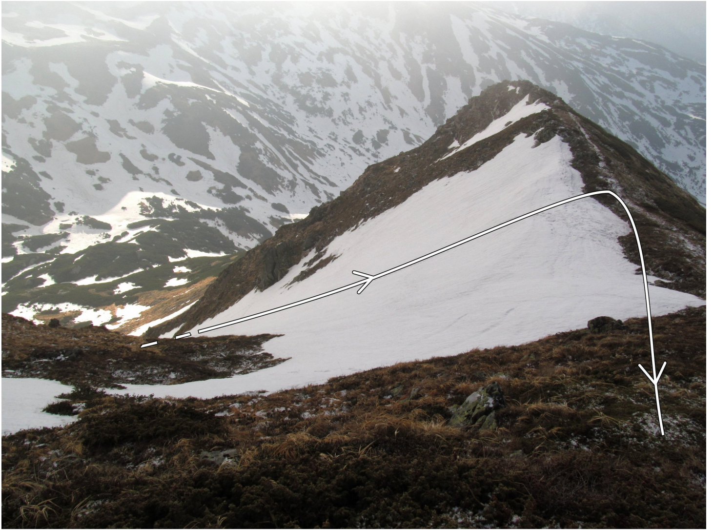
Фото 8: Сідловина