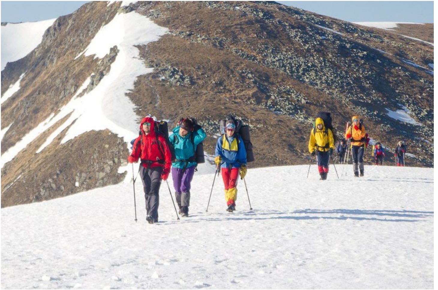
Фото 9: Рух по хребту