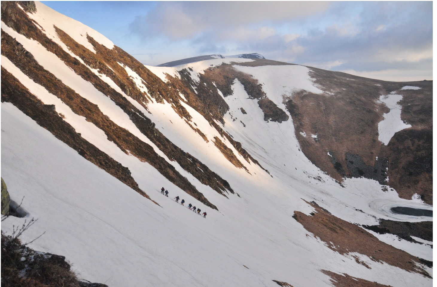
Фото 5: Група на підйом