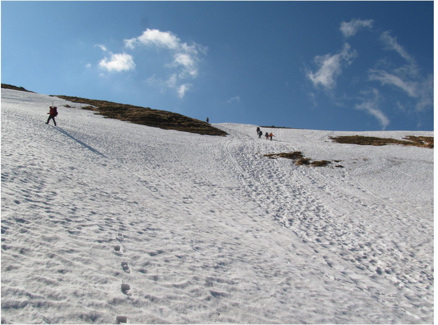
Фото 10: Спуск до оз.Несамовите