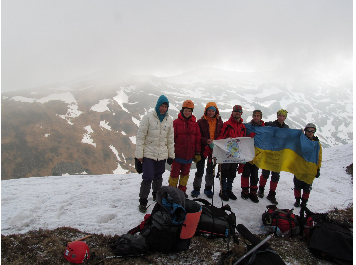
Фото 7: Група на сідловині (Північній)