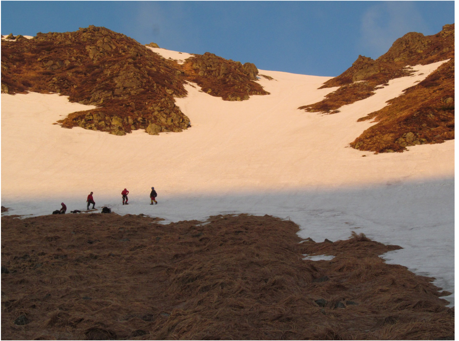
Фото 3: Вид на сніжний взліт