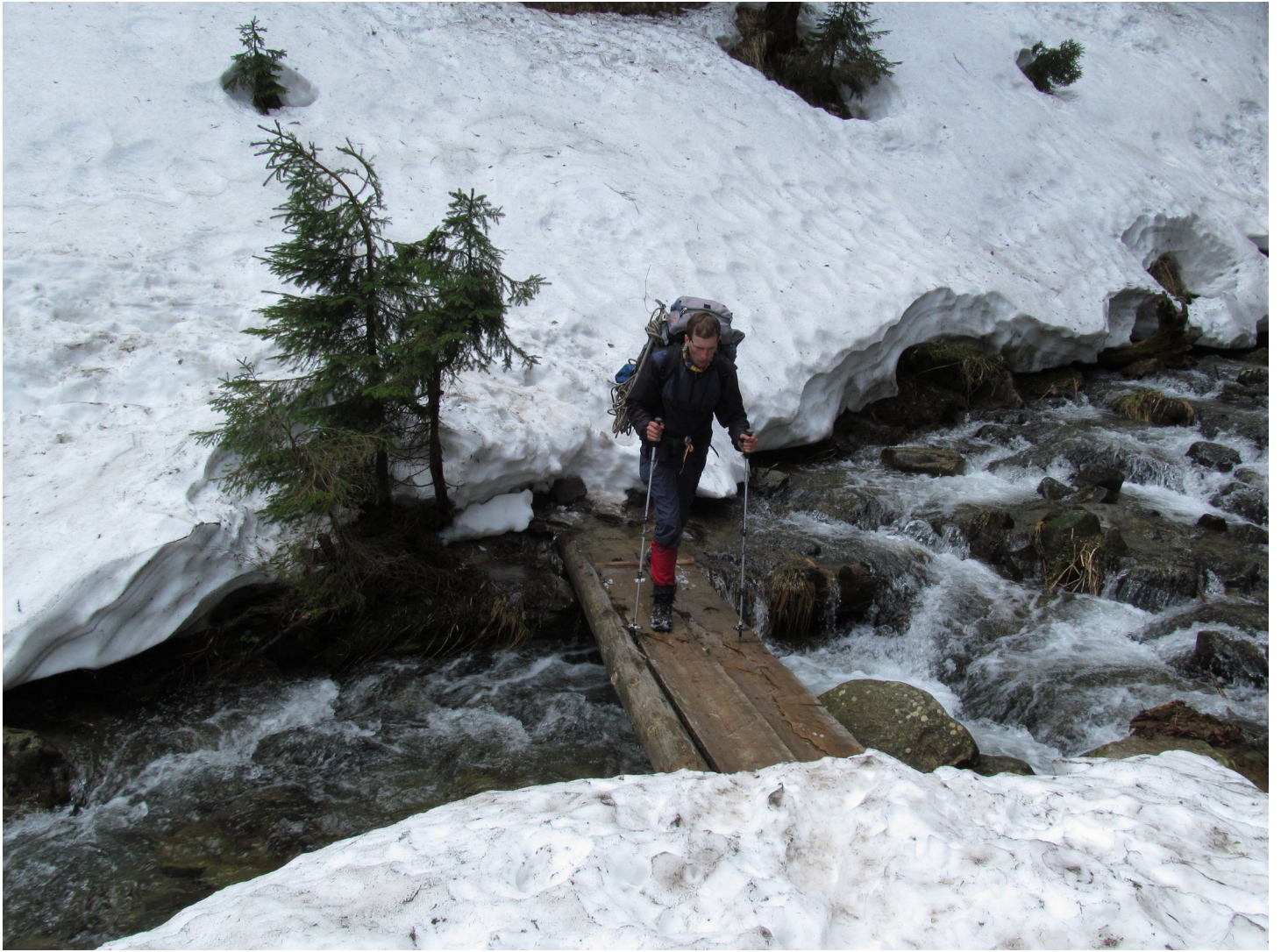
Фото 12: По дорозі до пол.Пожижевська