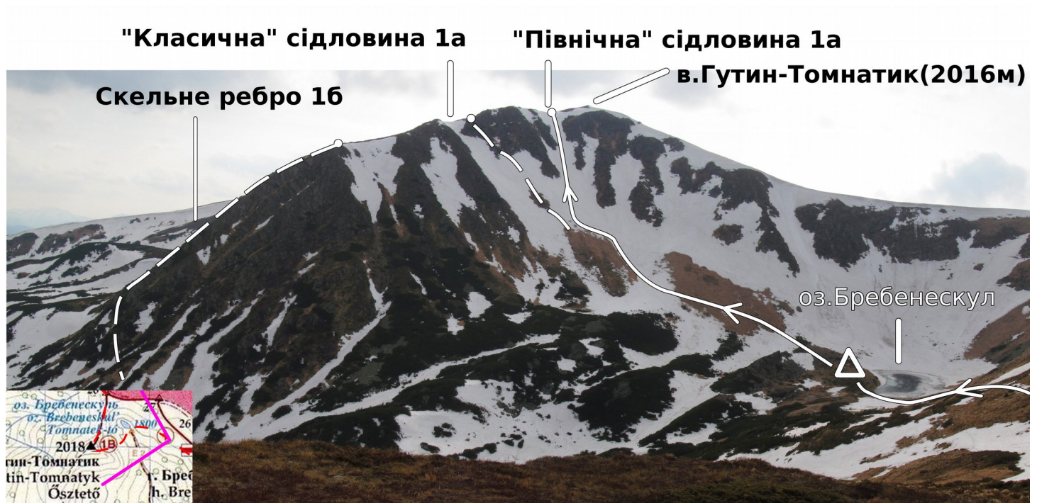
Фото 1: вид із стежки до озера