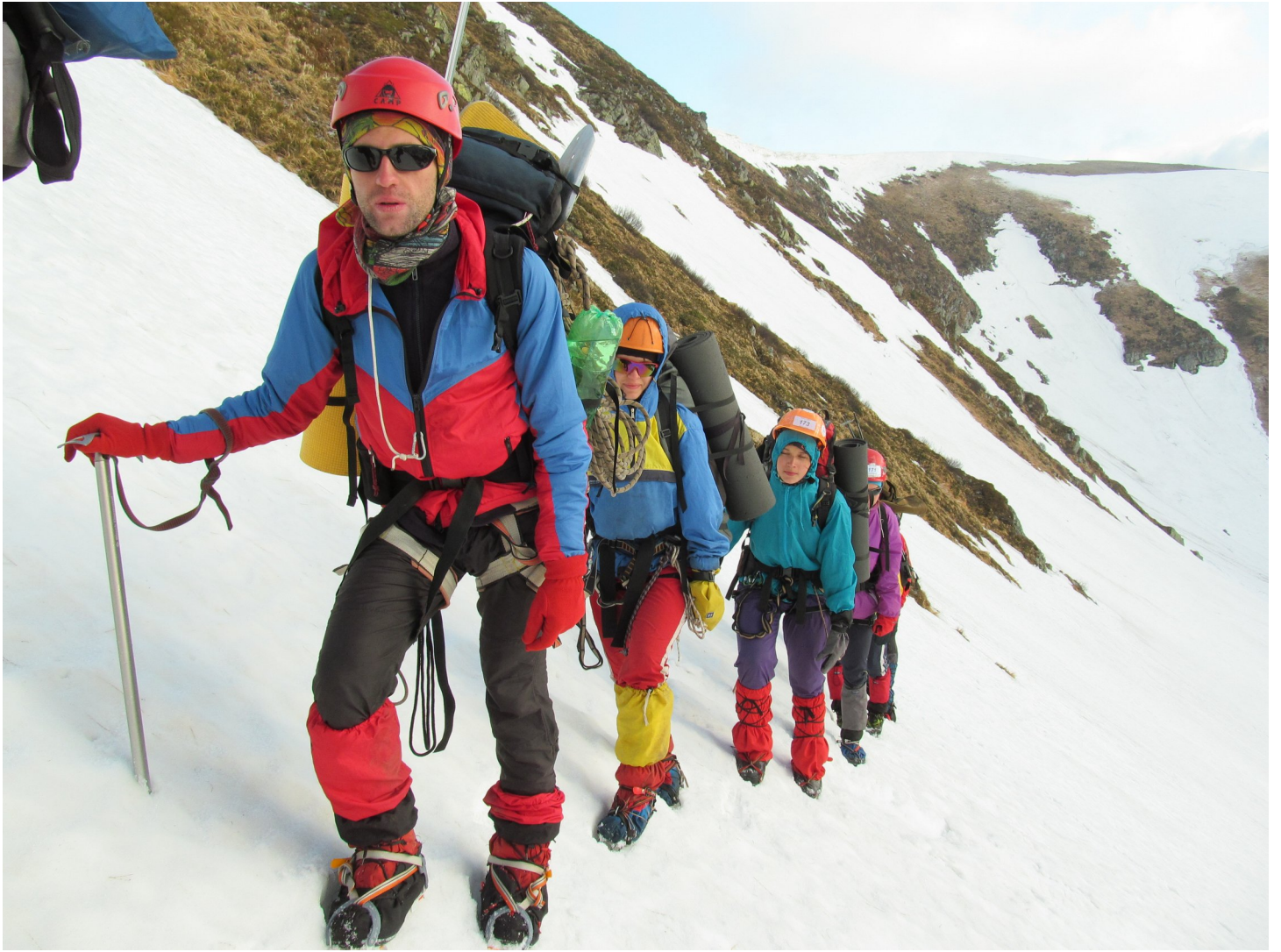
Фото 4: Група на підйомі